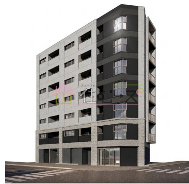
※イメージベースのため、現物とは異なる可能性があります。