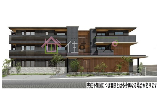
完成予想図につき実際とは多少異なる場合があります