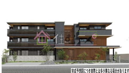
完成予想図につき実際とは多少異なる場合があります