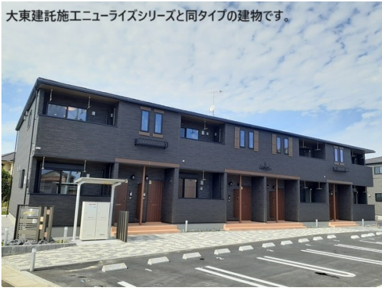
大東建託施工ニューライズシリーズと同タイプの建物です。