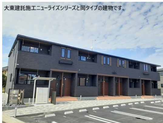
大東建託施工ニューライズシリーズと同タイプの建物です。