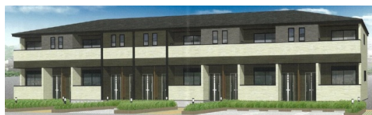
外観イメージパース